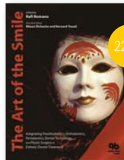
The Art of the Smile: Integrating Prosthodontics, Orthodontics, Periodontics, Dental Technology, and Plastic Surgery in Esthetic Dental Treatment