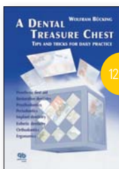
A Dental Treasure Chest Tips and Tricks for Daily Practice

Изнеса лекции в областта на оклузията, протетичната стоматология и на имплантологията. Изключително популярен в Германия с книгата си "A Dental Treasure Chest" и множеството си публикации, в които споделя трикове и техники за подобряване на ежедневната клинична практика.